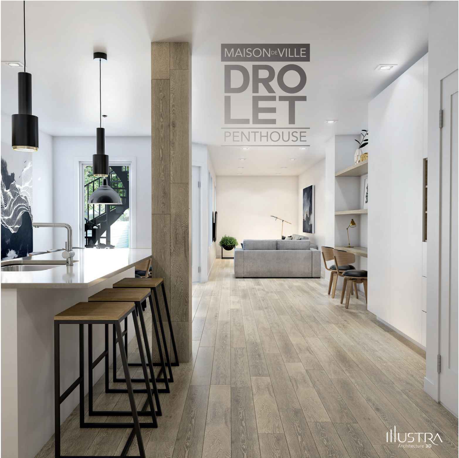
ILLUSTRATION Architecture 3D